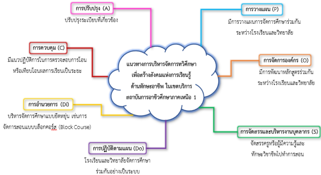
ภาพที่ 1 แนวทางการบริหารจัดการทวิศึกษาเพื่อสร้างสังคมแห่งการเรียนรู้ด้านทักษะอาชีพในเขตบริการสถาบันการอาชีวศึกษาภาคเหนือ 1